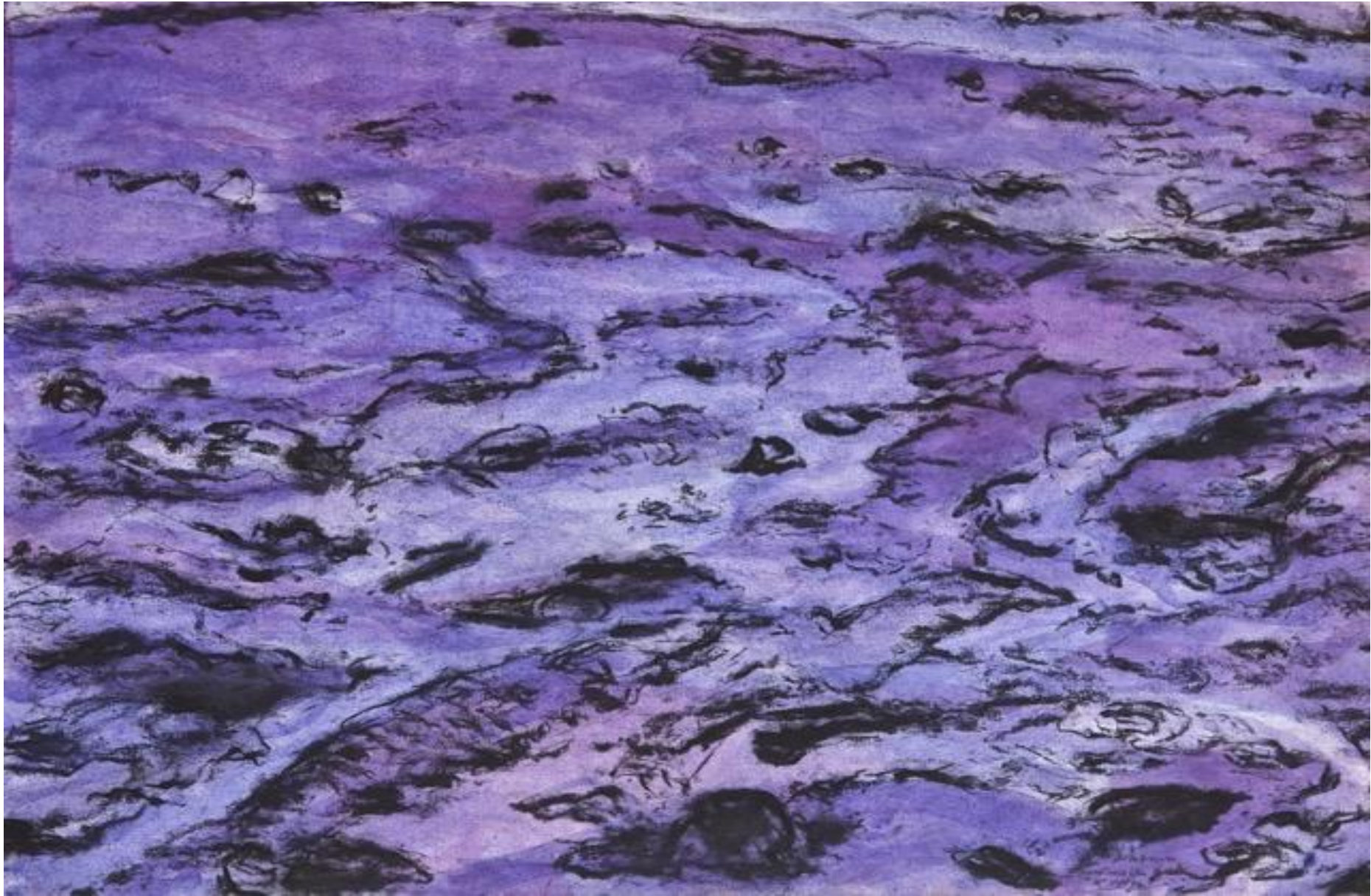
Jean Jacques Dournon " marée basse bleu-mauve " septembre 1997 acrylique et fusain sur papier 56 x 76 cm DD n° 216