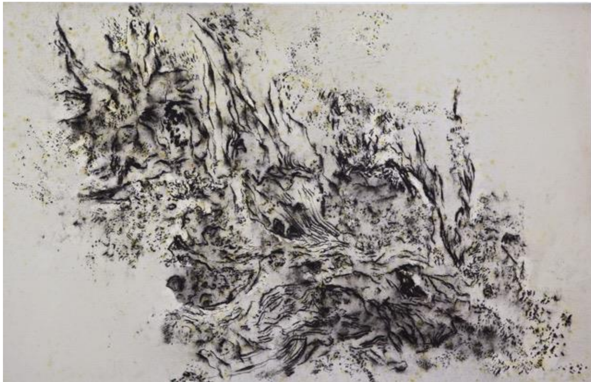
Jean Jacques Dournon " racines n° 1 " acrylique et fusain sur papier marouflé sur toile 101 x 153 cm septembre/octobre 2011