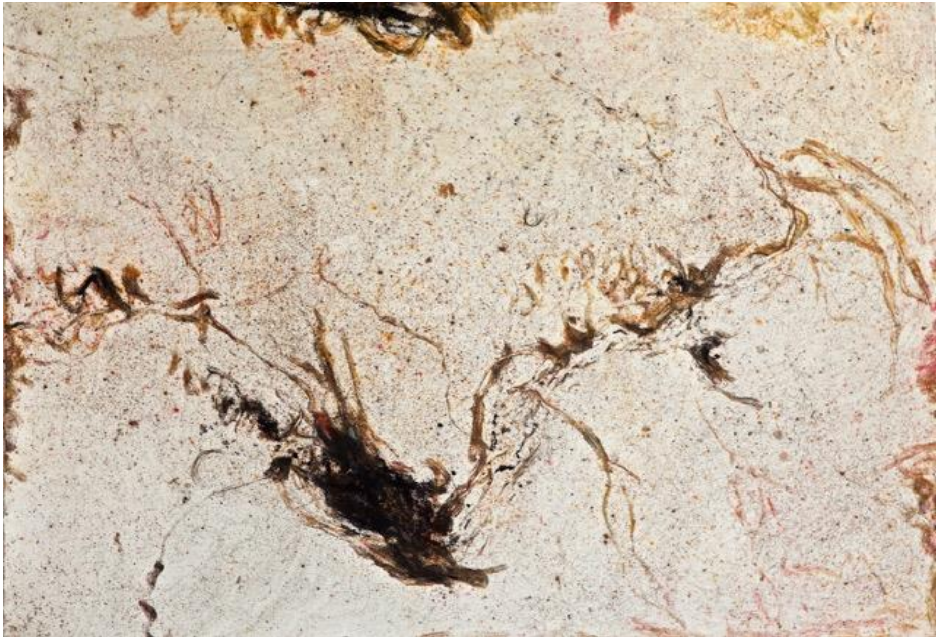
Jean Jacques Dournon DD n° 3252 cheveux sciure de bois acrylique pastels secs 56 x 76 cm février 2018